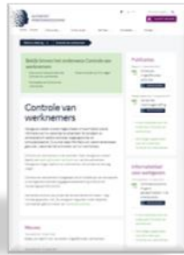
Autoriteit Persoonsgegevens 'Controle van werknemers is niet verboden'