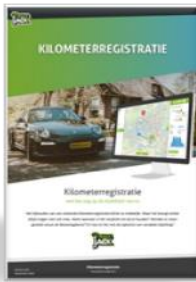
Whitepaper Kilometerregistratie en alle eisen van de fiscus