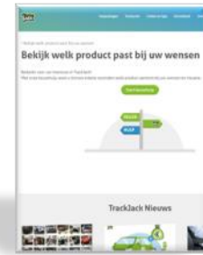
Keuzehulp Welke blackbox is voor u geschikt?