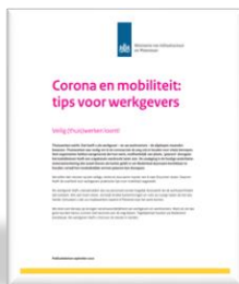
De Rijksoverheid Folder 'Corona en mobiliteit: tips voor werkgevers'