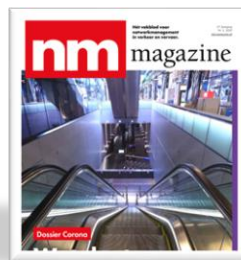
NM Magazine Hét vakblad voor netwerkmanagement in verkeer en vervoer.