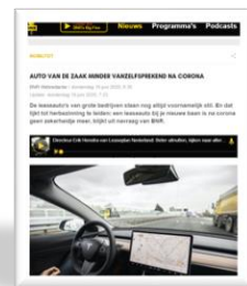
BNR.nl Auto van de zaak minder vanzelfsprekend na corona.